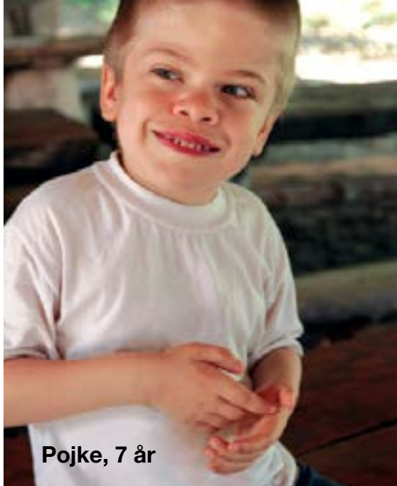
Pojke, 7 år