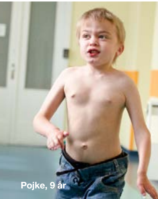
Pojke, 9 år