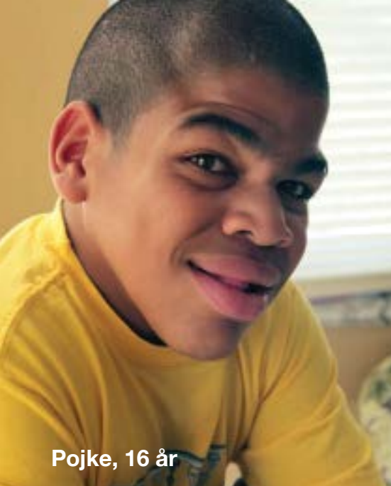
Pojke, 16 år