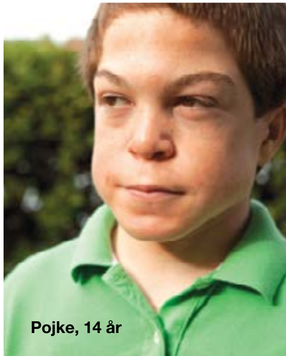
Pojke, 14 år

Kontakta sjukvården om du misstänker Hunters syndrom.